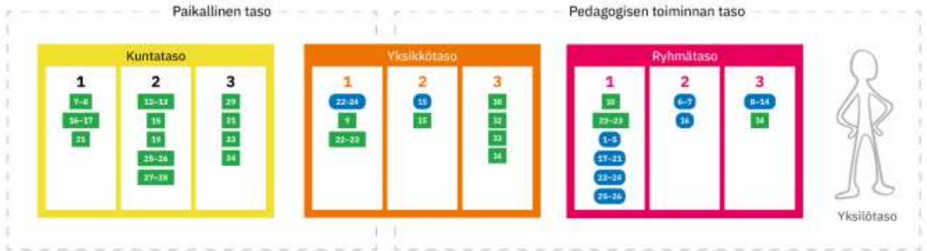
Kuvio 1. Joensuun seudun laadun arviointimalli 2020 (Karvin varhaiskasvatuksen laadun indikaattoreihin pohjautuva)