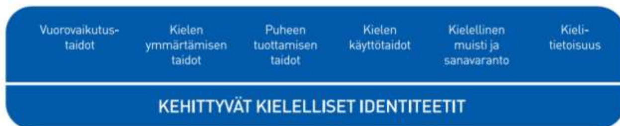
Kuvio 2. Lasten kielen kehityksen keskeiset osa-alueet varhaiskasvatuksessa

Kielen oppimisen kannalta on tärkeää tiedostaa, että saman ikäiset lapset voivat olla eri vaiheissa kielen kehityksen eri osa-alueilla. Kielelliset identiteetit kehittyvät , kun lapsia ohjataan ja tuetaan kielellisten taitojen ja valmiuksien keskeisillä osa-alueilla.