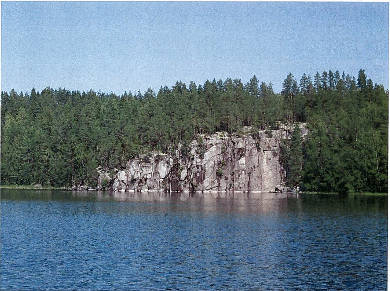
Kuva Heinäveden reitiltä.

Heinäveden kunnanvaltuusto hyväksynyt 9.3.2009 § 15 Voimaantulo 16.3.2009