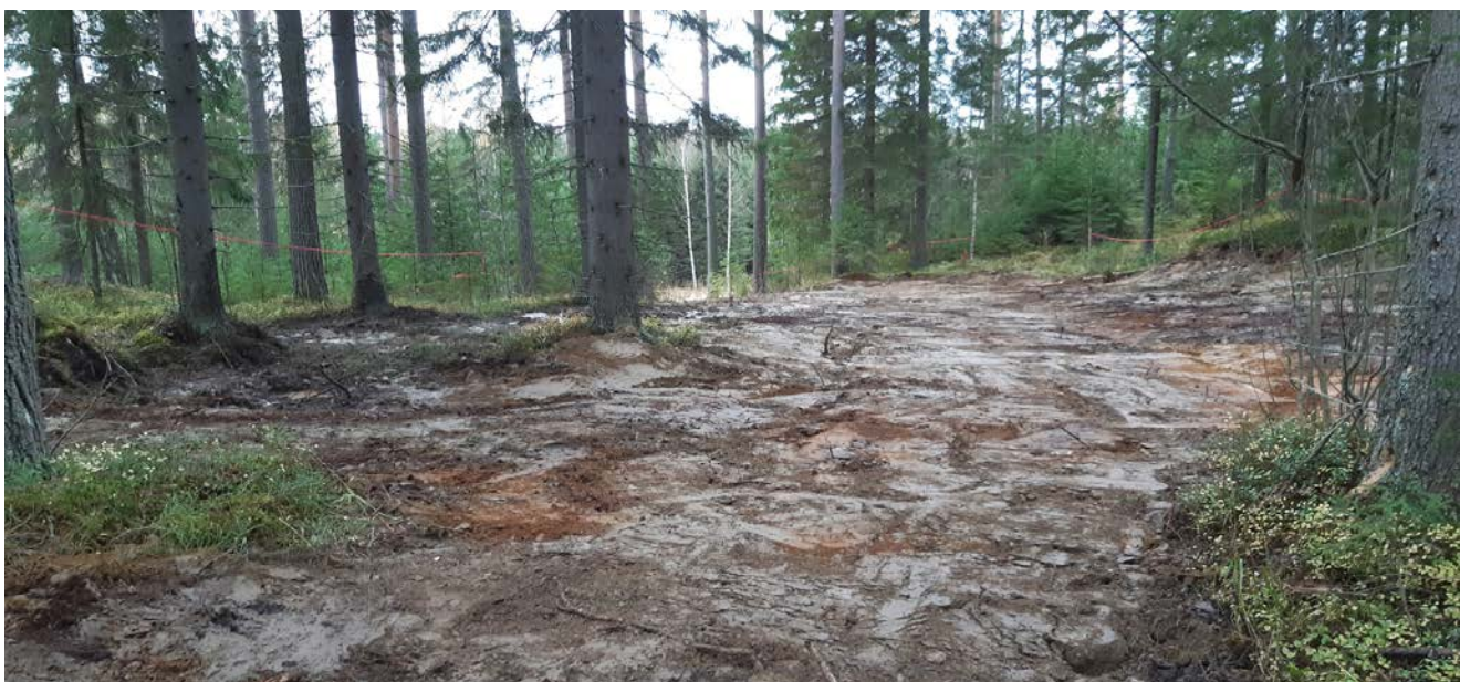
Tutkimuskaivanto peittämisensä jälkeen.