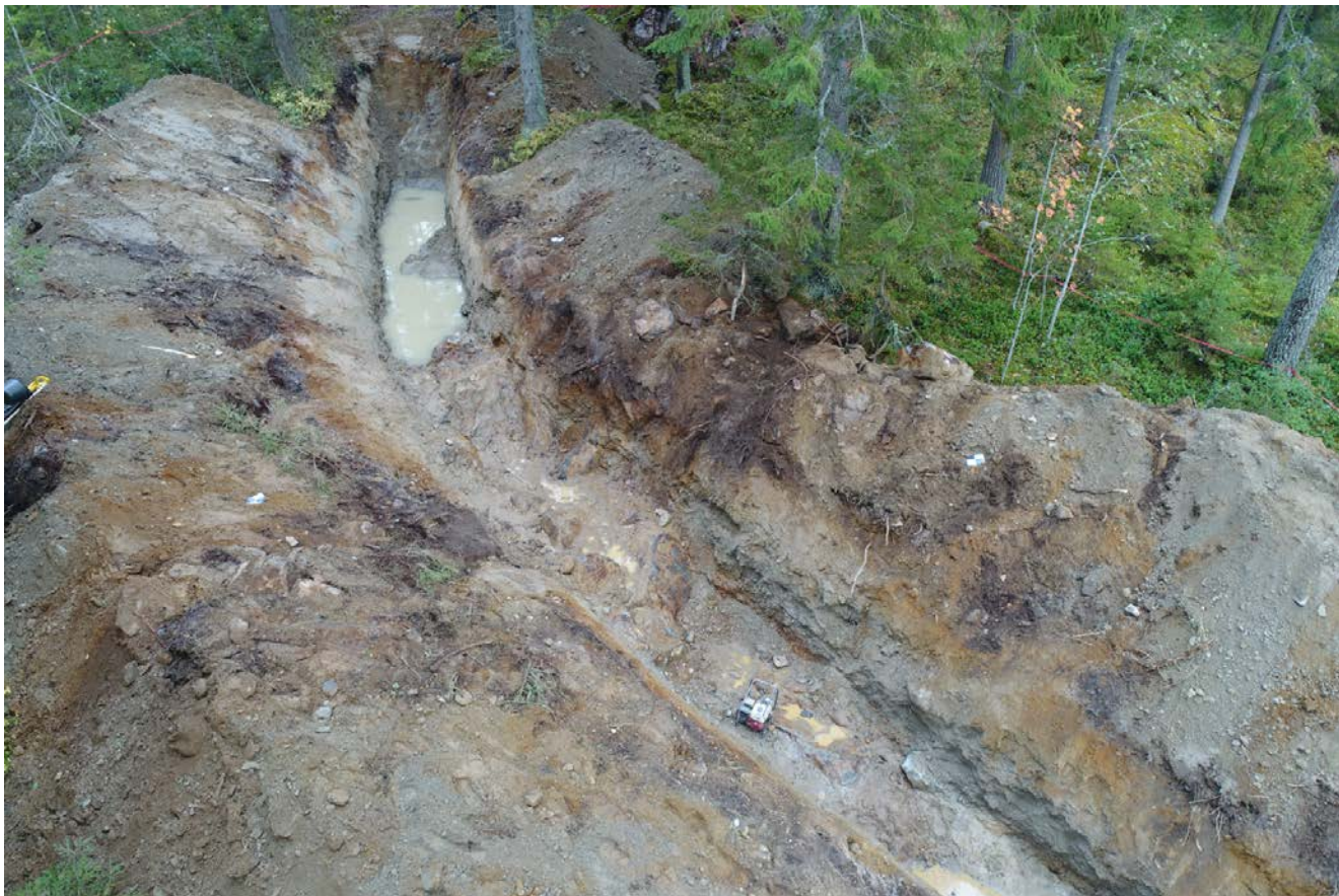
Tutkimuskaivanto dronella kuvattuna.